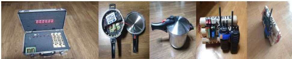
디지털 타이머 IED